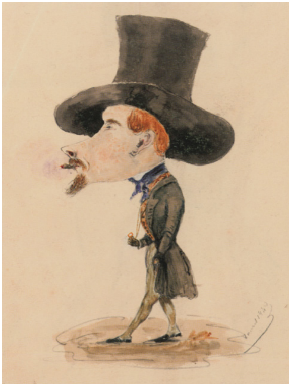
Justin de Labeville, Sénateur, par Alphonse Balat, avril 1842

Grâce aux caricatures d'Alphonse Balat et d'Henri Lemaître (coll SAN), ou encore de Félicien Rops, les élèves seront invité-e-s à définir l'art de la caricature. Un parallèle est-il possible dans le cinéma ? Vient ensuite le temps de s'interroger sur ce moyen d'expression, le(s) type(s) de message(s) qu'il véhicule et d'amorcer la question de la liberté d'expression. Pour terminer, place à la créativité : Pictionary d'expressions caricaturales à faire deviner, création d'une caricature à partir d'une photo et/ou élaboration d'un story board sur base d'un dessin au choix sont au programme !